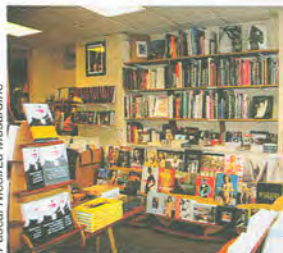
Pascal Nicolli/La Musardine

Librairie La Musardine, 122, rue du Chemin Vert (XI e ). Tél. : 01 49 29 48 55.