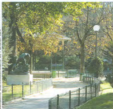
Guillaume Marousse/Mairie de Paris/DE/LEV

Square Maurice-Gardette, 2, rue du Général-Blaise (XI e ).