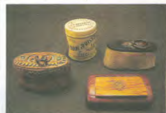
Musée du fumeur

Musée du fumeur, 7, rue Pache (XI e ). Tél. : 01 43 71 95 51.